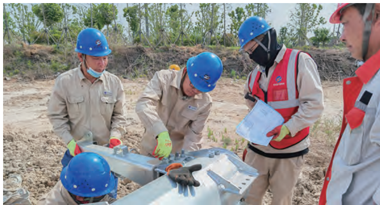
连日来,供电公司徐南供电全体员工抢抓当前施工有利时机,保安全、保进度,全力以赴推进金额达495万元的连云港延伸段10KV电力线路迁改工程,确保为当地居民和企业提供更高质的电力服务。(周国成)

业务科学管控“合规合法”。按照市政行业标准认真做好工作日志、考勤记录、计量签证、影像资料等各类台账。严格按照施工进度凭材料出库单发放使用,并且实时对使用情况进行监督,杜绝材料浪费。开好每日班前会、每周现场例会、每月工作例会,施工前后注重对班组作业设备、工具妥善保管和维护。严格执行“三检”制,即自检、专检、联检,通过层层检查,验收后方允许进入下一道工序,确保工程质量达标。(孙君明 高扬)