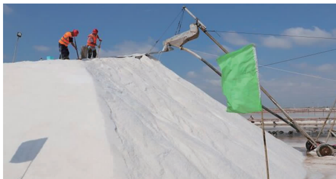
11月5日,伴随随南制盐分公司最后一台机组扒盐结束,标志着日晒制盐公司秋扒工作圆满结束。从9月9日开机扒盐以来,历时58天,扒盐量21.28万吨,圆满完成秋扒工作任务。(靳静)

在贯彻执行“双控”政策上,上元公司始终把“早谋划、早实施”放在首位,把“算大账、算细账”摆在前方,把“讲规矩、讲政策”摆在前面,贯彻政策“不折不扣”,执行政策“表里如一”。今年以来产销板材78687m 2 、砌块45415m 3 ,实现营业收入5025万元。(房宣 占骥源)