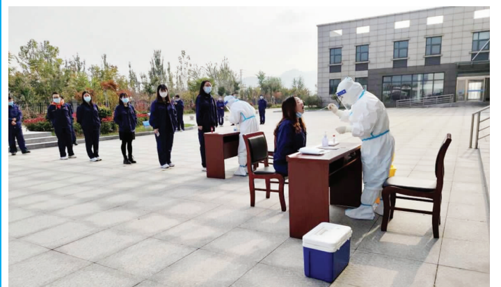
为积极应对疫情防控新形势,确保安全生产,11月2日上午,开发区管委会经济发展局企业防控组联合猴嘴社区卫生服务中心,到神特新材料公司开展新冠肺炎疫情应急处置和全员核酸检测演练。整个演练贴近实战,为高效处置实际疫情事件积累了宝贵的经验,达到了预期目的。(神特宣)